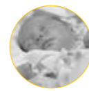
Vision de nuit par infrarouge