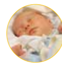
Mode lumière du jour